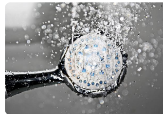
Me ducho por la mañana.