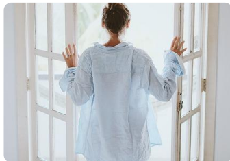
Me levanto y me lavo la cara.