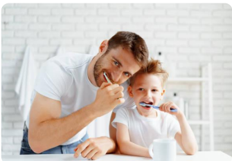
Me cepillo los dientes.