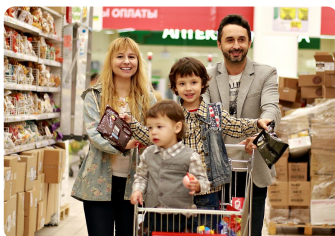
Nos vamos de compras.