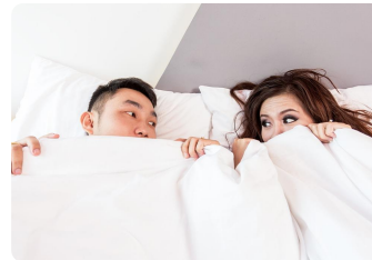
Me acuesto temprano por las noches.