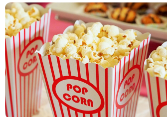
Me divierto viendo películas.