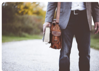
Me dedico a la enseñanza.