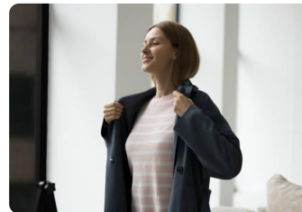
Me visto para ir al trabajo.