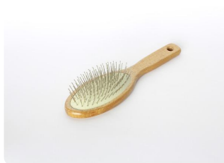
Me peino el pelo rápidamente.