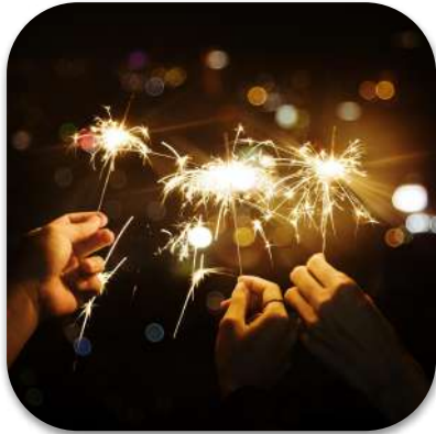
la fin de l'année