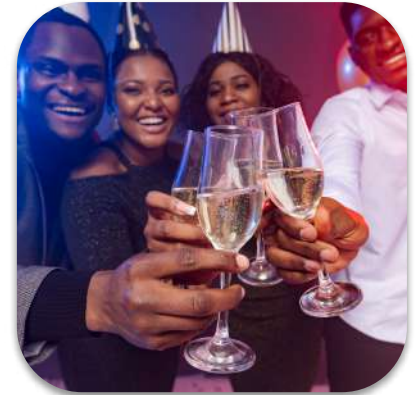
pendant la fête