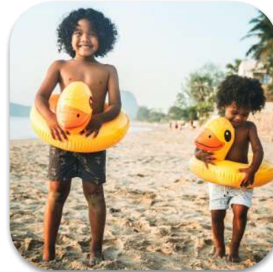
les vacances d'été