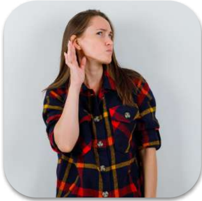
un bruit étrange